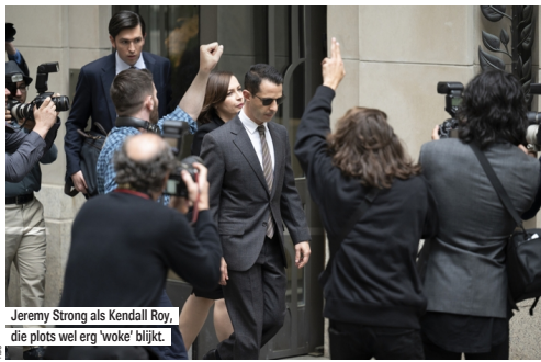
Jeremy Strong als Kendall Roy, die plots wel erg 'woke' blijkt.